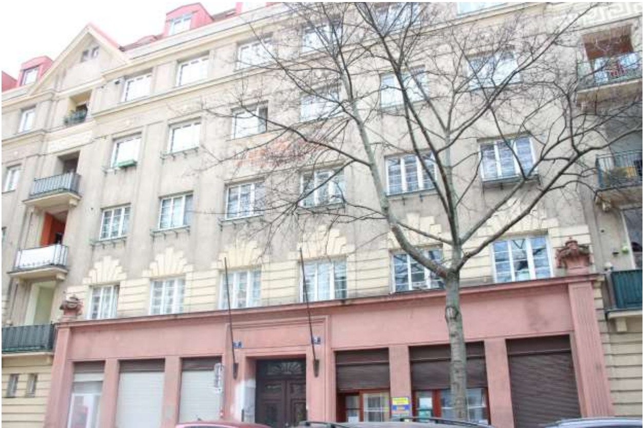
Das Haus in der Chrobackgasse 3-5